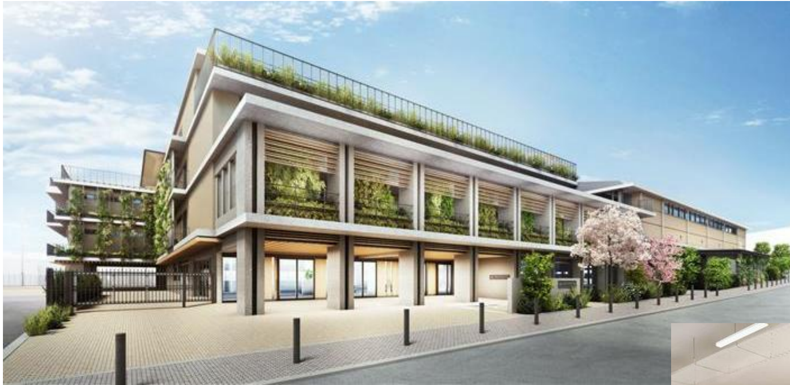
目黒南中学校のイメージ図（令和10年度以降完成予定）