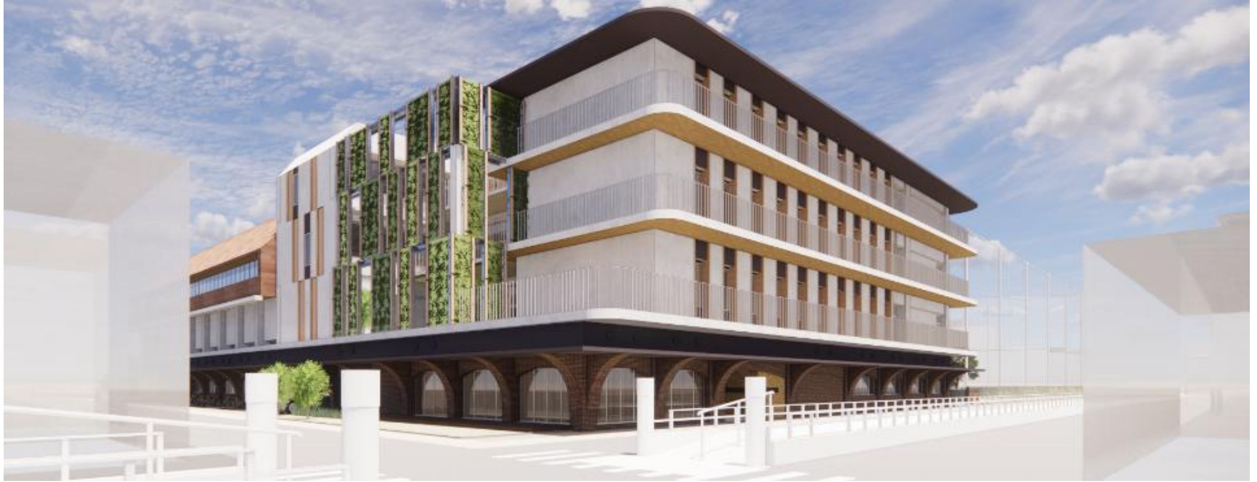
向原小学校のイメージ図（令和10年度完成予定）