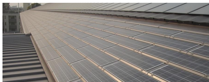
▼太陽光発電パネル