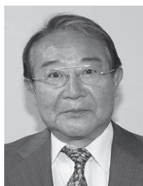
片山教育長 職務代行者