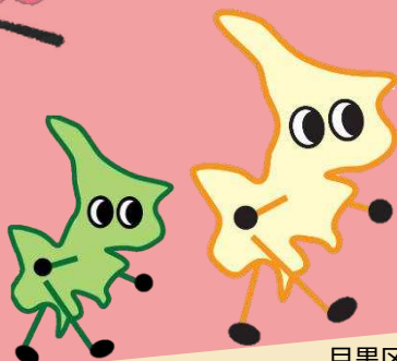
目黒区健康づくりサポートキャラクター 「めぐろっち」