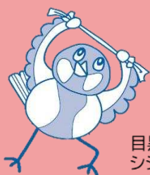
目黒区介護予防マスコット シジューカラの「しじゅちゃん」