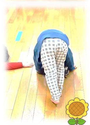
上：とんぼ (石に止まるポーズ) 左：かかし

乳児クラスはそれぞれの保育室で、保育士がリズムの歌をうたいながら身体を動かすと、子どもたちも真似をしたり、座って見ながら気持ちは一緒にやっていたりする姿が見られます。歌に合わせて動物のイメージをしながら、保育士や友達と体を動かして楽しむ経験を積み重ね、体幹を育てています。