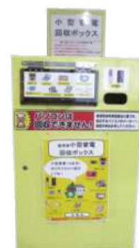
小型家電回収ボックス