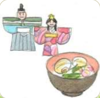
目黒の祭事 ひなまつり