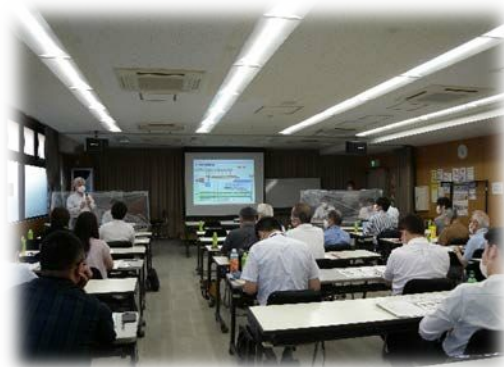
＜都市計画（原案）説明会の様子＞

目黒区より、都市計画手続きの状況について、同日午前にかかれた目黒区都市計画審議会に、「自由が丘駅前西及び北地区地区計画」及び「自由が丘一丁目29番地区 第一種市街地再開発事業」が付議されたとの報告がありました。その後8月11日（火）には地区計画が都市計画決定されました。第一種市街地再開発事業は、建築制限条例制定後に都市計画決定が予定されています。