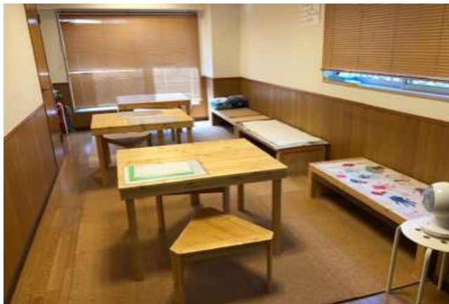
学習スペースの様子