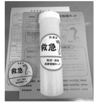
防災・救急医療情報キット